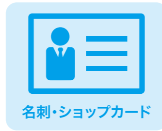
名刺・ショップカード